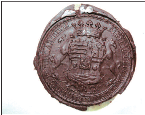
SIGILLUM LIBER ET REGIAE CIVITATIS TEMESVARIENSIS - SIGILIUM ORASULUI TIMISOARA - CEARA ROSIE - APLICAT